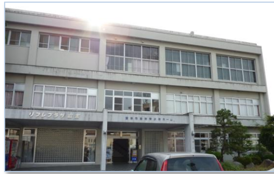
倉吉文化団体協議会 (倉吉市勤労青少年ホーム内)